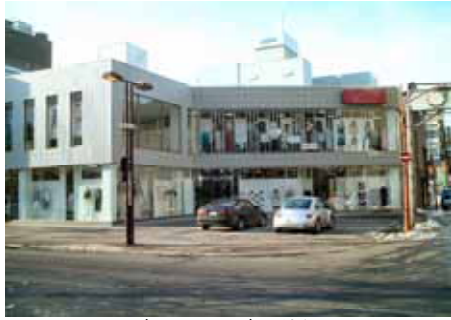
バレンシアビル外観。店舗前に駐車できます。

先日、講師セミナーを開催し、「広告やチラシについて」を勉強しました。新聞折り込みのチラシには、よく「この商品がこんなに安い」と言う価格を前面に打ち出した物がありますが、これは単なる価格表であって情報をお知らせするといつ本来のチラシの使命を果たしていない。お客様が本当に知りたい、興味のある物は「どんな店なのか?」「どんな人が経営しているのか?」「どんな考えで販売しているのか?」「どんなこだわりの商品なのか?」と言うことを知りたいか?と思うと、一工夫の加工が必要だ。とおっしゃっていました。 また、「明るい」「暖かい」「新しい」「楽しい」「速い」「安い」ものを求めている。店内が明るいと同時に雰囲気も明るく、品物が新しく、商品の情報も新しい。記念日セールなど楽しく、わくわくさせるイベント、お客様のニーズにいち早く対応し、早い時間を過ごしていただくようなストーリーを展開することで、顧客の固定化、お店のファンづくりをしなければなりません。店の人気の原点は「元氣」沈んだ雰囲気や暗いムードはお客様に敬遠されます。 カラ元気でも良いから「いらっしやいませー」と元気いっぱいをアピールしましょう。