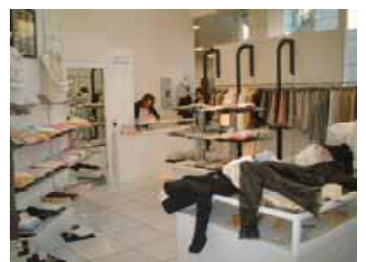
1階 ルーニィ・ピースモンテ

確保し、入口の段差を無くしたバリアフリーでエレベーターも備え、お客様への気配りも充分。 バレンシア これまでと比べて売り場面積を広くとり、ゆったりと商品を見ていただけるようになりました。また、入口から奥へ2階へと年代別のコーナー展開。サイズ展開をして、より見やすくを心がけています。 ルーニィ・ピースモンテ 売り場は吹き抜けで開放感のあるショップです。今回のオープンに向けてブランド