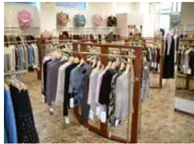
2階バレンシアの売り場です。

3月9日、婦人服販売のバレンシアが市内西3南9の駐車場跡に建設していた自社店舗が完成しオープンしました。これまでは大洋ビル1階にバレンシア、西2南10にルーニィ・ピースモンテの2店舗で別々に展開していましたが、新たに若者向けの「フェリチタ」を加えて3店舗態勢となりました。 新店舗は鉄筋「コクリート」造り2階建て、1階の西側半分が20代から40代の女性を対象とした「ルーニィ・ピースモンテ」と「フェリチタ」、東側半分と2階が中高年層向けの「バレンシア」で構成されています。店舗前には6台分の駐車場を