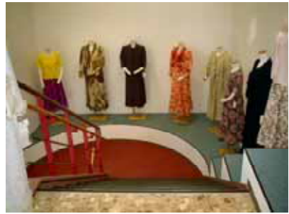
2階への階段踊り場にも華麗にディスプレイ

3月9日、婦人服販売のバレンシアが市内西3南9の駐車場跡に建設していた自社店舗が完成しオープンしました。これまでは大洋ビル1階にバレンシア、西2南10にルーニィ・ピースモンテの2店舗で別々に展開していましたが、新たに若者向けの「フェリチタ」を加えて3店舗態勢となりました。 新店舗は鉄筋「コクリート」造り2階建て、1階の西側半分が20代から40代の女性を対象とした「ルーニィ・ピースモンテ」と「フェリチタ」、東側半分と2階が中高年層向けの「バレンシア」で構成されています。店舗前には6台分の駐車場を