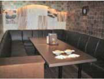
カラオケの設備がある1ルームタイプもあります。収容人数12名

飲み放題付きのお料理セットで3,000円〜5,200円までご予算に合わせてお選び頂けます。 日本全国にて人気沸騰中の「新しい白木屋」は、年中無休で午後5時から翌午前5時まで営業しており、皆様のご来店をお待ち申し上げて