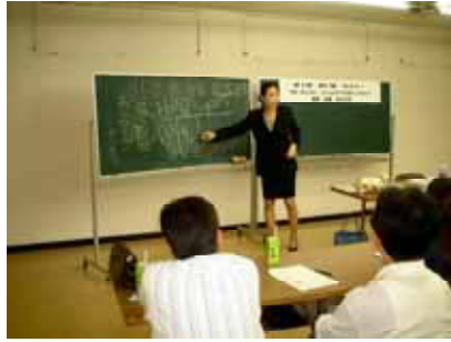
第1回商い塾「接客、初心に帰る」講座

街地活性化法 大型店立地法 改正都市計画法が制定され6年が経過しましたが、当初期待された効果は得られず、中心市街地は活性化するどころか、この3法が制定されたときよりさらに寂れているのが現状です。