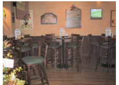
2階の壁や天井からのスクリーンにも映像が映し出されます!

中心部で新しく開業したお店をご紹介します。 掲載料は無料ですので、ご希望の方は、いらっしやい瓦版編集局までご連絡下さい。 連絡先は、4ページの記事募集欄に掲載しております。