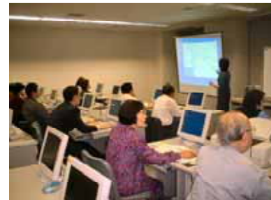
第3回商い塾「パソコンでどんなことが出来るの？お店の仕事に役に立つの？」パソコン講座

るとともに、少子高齢化で人口が減少傾向のある中、膨れあがった都市を維持するために、最後は税金のアップという住民の負担増になって現れます。これからの都市は出来るだけコンパクトにし、維持経費を抑えなければならなくなるでしょう。 こういふ問題を解消するために、法の整備を含め全国的に運動が展開されていますが、まだまだ時間がかかりそうです。