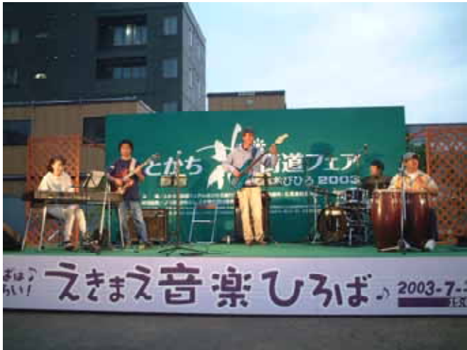
昨年の「えきまえ音楽ひろば」のステージ

広を何がそうさせたのか？ 我々は自分達の街を自分達で取り戻したい。 今帯広の中心街では、北の屋台や高齢者下宿等をはじめとして、新たな動きが芽生え始めている。我々は自分達の街に音とイベントを通じて賑わいを創りたい。 この「帯広にぎわいフェス