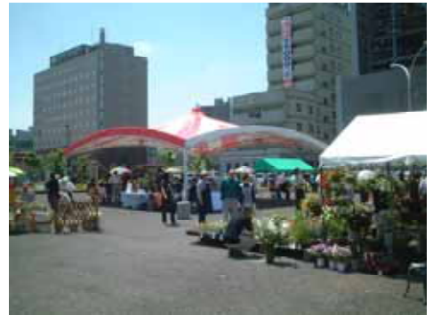
大型店テントを設置して雨対策も万全です。