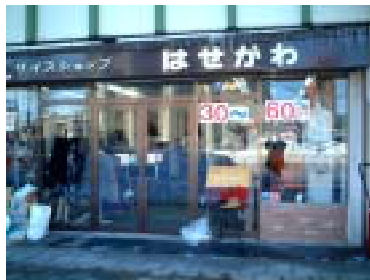
Lサイズショップはせがわ(大通)

「その他に、どんな苦労がありましたか?」「普通サイズでフリーなデザインが流行したときは売上がダウンしました。」(はせがわ)「2Lや3Lでは大きさが足りずに4L、8Lサイズを探し回りました。」(オダ)「当店も17号以