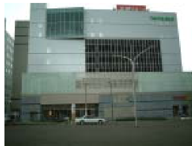
太陽ビル 本館正面

シネマ1 236名 シネマ2 96名 シネマ3 84名 シネマ4 104名 シネマ5 96名 ゆったりと座って、映画を楽しむので頂けるよう1館当たりの椅子の設置を少なくし、傾斜をつけて前列の人の頭が邪魔にならないようにしています。椅子はフランス製キネネット社の製品を使用