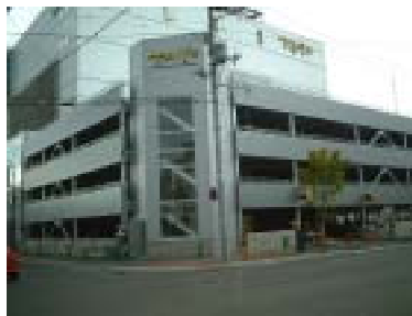
太陽ビル 別館駐車場

し、長く座っていても疲れないよう気配りをしています。また、「音響は最新のソニードルビーサラウンドシステムを導入していますのできつくとご満足頂けるのでは」と言うお話でした。