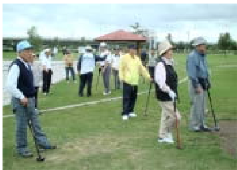
商店街親睦パークゴルフ大会2003

じて商店街相互の親睦や共同活動のパイプ役として事業展開をしています。また、個々の商店街が市民との関係をより深めるため、地域住民のニーズに応える組織活動を活性化させる人づくり、魅力ある商店街づくり、魅力ある店づくりを推進する支援を行っています。 その他に、中心部活性化の一つとして、まちなかの情報をお知らせする「ミニコミ誌「いらっしやい瓦版」の発行や中心部への交通アクセス対策として共通駐車券事業・共通バス券事業、連合会組織の中心部活性化協議会や青年部・女性部が合同での「まちなかクリーン大作戦」なども実施しています。 今回の大会では、全道の商店街から約500人の会員が帯広に集まり、より強い団結