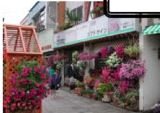
昨年の花コンテスト優勝のお店「アドサイン」

十勝・帯広もようやく暖かくなり、いよいよ花の季節が到来しました。市内の花屋さんには、たくさんのお客さんが花を求め、お客さんが大勢詰めかけています。昨年と比べるとガーデニング用品の種類も豊富