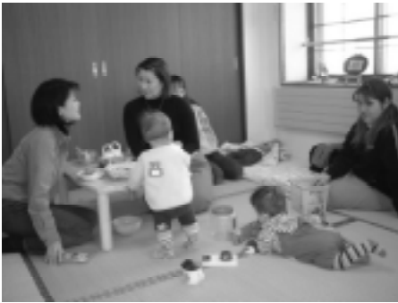
「菜の花キッズルーム」を知っていますか?子供とお母さんの一休みのお部屋です。場所は「六丁ムス菜の花」(西