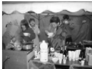
会場のテント内でメンバー手作りの飲み物サービス

分と決別し、キャンドルの炎と共に悲しい想い出を燃やして、今年のバレンタインデーを新しいスタートの日としよう!と若者男女5人が「夢あかり」でライトアップされた雪の特設ステージで告白イベントを企画したサポーターズクラブのメンバーからは、参加者にイベント名に掛けた「V・S・O・P」のバレンタインボトルをプレゼント。また、ホットドリンク(ココア、コヒ)・ホットワイン(卵スプ)のサービスも提供!