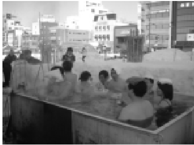
今年も露天風呂？が出現

昨年よりボランティアで準備を進めてきた「冬の遊園地」が18日開園しました。駅前会場で行われた開園式当日には「ほんえい競馬」の馬そり体験が行われ、10数人も乗れる大きな馬そりに乗って見る駅前の風景に歓