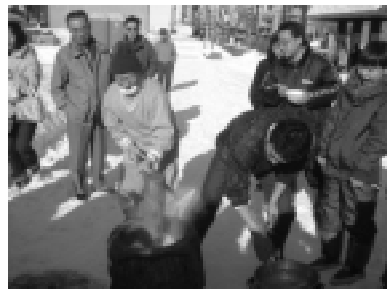
つきたて餅はとも美味しかった

声があがっていました。イグルーの中では氷のグラスで飲み物を飲む「アイスバー」も盛況だったほか、話題を呼んだ駅前露天風呂にも昨年よりも多くの物好き？な入浴者が湯気の向こうに見える市民に盛んに手を振り、何も知らずに通りかかった人たちはびっくりしていました。 スケート靴を借りたい人は十勝ガーデンズホテルへ 今年の大雪像は「タマちゃん」ならぬ「オビちゃん」。ボランティアが少人数にもかかわらずほぼ1週間で仕上げ