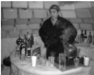
イグルー内の氷のカウンター。アイスグラスでカクテルを・・・