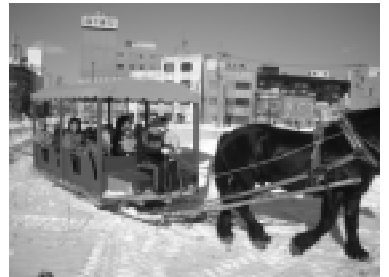
馬そりの体験に大喜び

冬の大運動会 2月2日(日)開催 また、中央公園北側広場には大きな滑り台と築山、雪合戦コートが出現し、連日