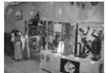
リジョナ ルディ ヤッディ ビディ ビディ は、いい ままで 十勝 無かつ た多

籍雑貨を伝えようと思ってい ます。ともにレゲエのバイブス を上げていこうとフインチ レコード、テープも販売してい ます。見に来るだけでもOK です。