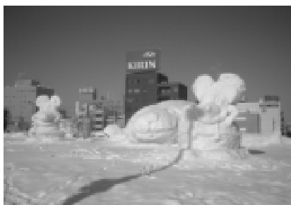
アザラシ？オタマジャクシじゃないのか？

1月24日から点灯 1月24日には「夢あかりアート」が一齐に点灯します。イルミネーションの他にさらに光のアートが加わり、中央公園はいつもとは違う楽しい幻想的な雰囲気。ご家族連れで、休日などにぜひお出かけください。