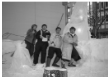
サポーターズクラブでは会員を募集中です。問い合わせは、市振連事務局へ

サポーターズクラブでは、昨年藤丸ふれあい広場に作成した「夢あかりアート」を今年も平原通商店街と栄通商店街で整備した「まちなか広場」(西2南10)に作り直した。雪像で家を造り、その周りにミニチュアの夢あかりアートを配置。市内の各家庭でもこのようにすれば冬の「アート」に参加出来ます。Tズをテーマに制作しました。帯広中の住宅の庭にこのような「光のアート」がたくさん出来れば